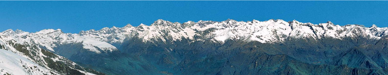
Il ghiacciaio Basei nel 1928 (in alto) e oggi (in basso)