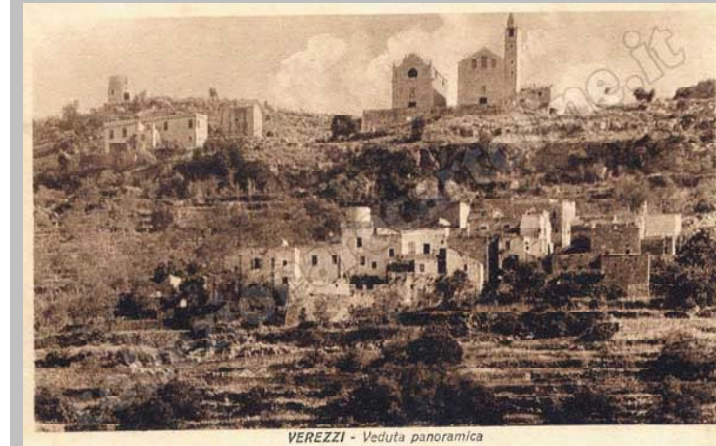
VEREZZI - Veduta panoramica