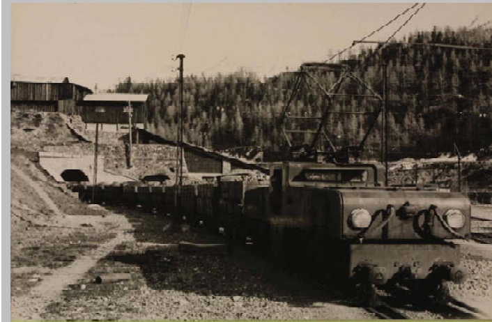
Ferrovia del "Drinc", Stabilimenti Elettrosiderurgici Ansaldo. Cogne, 1922 ca. Valle d'AOSTA Structure, AOSTA

La realizzazione del complesso di Colonna a 2400mt (Monte Creya) e degli impianti di frantumazione di Moline (frazione di Cogne, 1600mt circa) inizia nel 1909. Nel 1916 ne diventa proprietaria la Soc. Gio. Ansaldo di Genova, che risolve il problema del trasporto del minerale acquistando la carrabile Cogne-Aymavilles (costruita dai prigionieri austro-ungarici della prima guerra mondiale). Nel 1922 si concludono i lavori della ferrovia del Drinc. Un'opera rivoluzionaria ingegneristica, che ha permesso lo sviluppo dell'industria siderurgica nazionale e valdostana per 50 anni, invertendo la direzione migratoria delle genti. Anche chi è arrivato dopo il 1979 (chiusura della miniera), ha trovato a Cogne un paese benestante, cosa non tanto comune nelle valli alpine, e questo soprattutto grazie al lavoro prodotto dall'immigrazione nei decenni precedenti. Il trenino è in realtà un monumento vero. E ha continuato a essere via di fuga ogni volta la strada rimaneva chiusa per cause climatiche. In media ogni due anni!