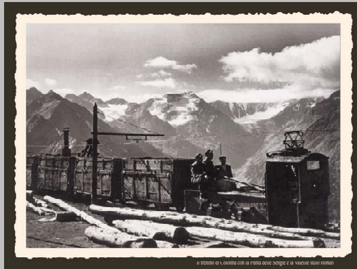
Il trenino di Colonna con la punta delle Segre e la valle sotto sfondo

Colonna è il villaggio minerario più alto d'Europa e l'estensione delle coltivazioni fino ai 2500 metri di Liconi rappresentano anch'esse un primato eguagliato solo dalle miniere della Val Ridanna. La scelta che si sta per compiere ovvero di rinunciare definitivamente dopo 30 anni di costosa manutenzione ad ogni possibilità di una rimessa in gioco di tale patrimonio, appare particolarmente miope soprattutto se si considera che finalmente dopo una attesa di decenni sta per prendere avvio il progetto di restauro e valorizzazione delle parti in bassa quota. Laddove un piccolo restauro delle parti in bassa quota, con un brevissimo percorso nel primo tratto di una galleria "ferroviaria", abbinati al già esistente museo minerario, si dimostrasse la validità dell'investimento grazie ad un crescente interesse dei visitatori, numericamente verificabile, si sarebbe preclusa comunque fin dall'inizio la possibilità di rendere accessibili le parti autenticamente minerarie. Questo errore non deve essere commesso almeno fintanto che la prima parte del recupero non è stata condotta e resa operativa.