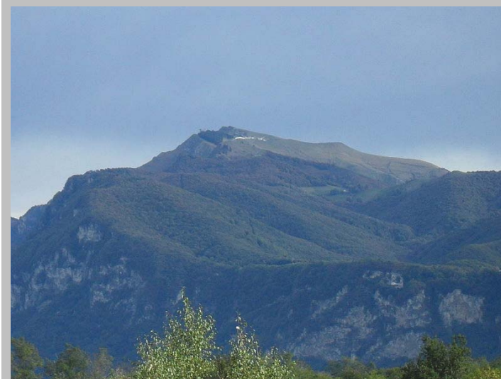
Fig. n. 3: Versante Sud-Ovest del Monte Generoso: sotto la vetta è osservabile la banchina d'arrivo dell'antica ferrovia a cremagliera che parte da Capolago.

Il Monte Generoso o Calvazione (1.704 m s.l.m.; Mont Generos, Casgnon o Calvigion[1] in lombardo) è un monte delle Prealpi Luganesi situato al confine tra Svizzera e Italia. La vetta conosciuta anche come Punta Cådola è condivisa tra il comune italiano di San Fedele Intelvi e quello svizzero di Rovio. Del massiccio fa parte una cima leggermente più bassa detta Baraghetto (1.701 m s.l.m.), appena più a nord di quella principale